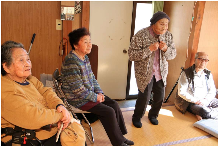
佐野診療所の中は2間で、ドアを開けてすぐに畳敷きの「待合室」があり、その奥に「診察室」がある。