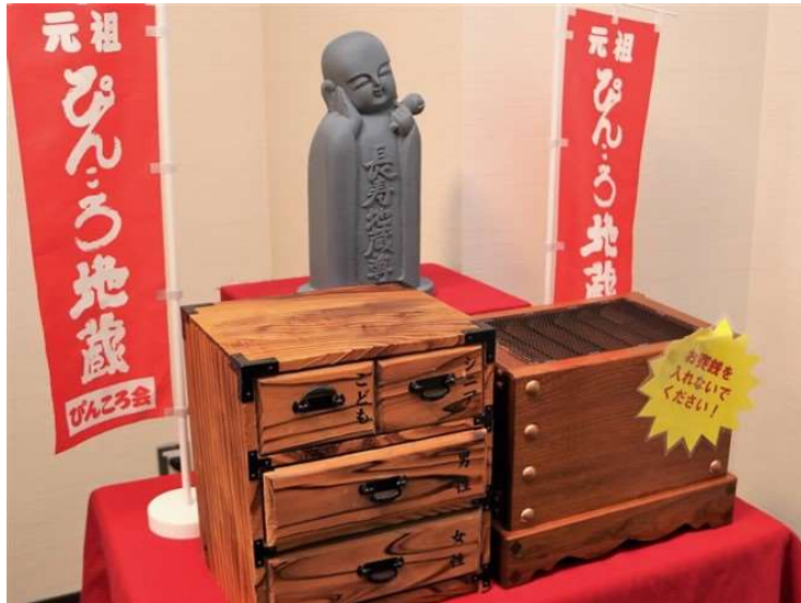
地藏の手前には各属性に合った内容のおみくじが入っている

お告げの種類は約30種類で、地藏の手前にある木箱には「男性」「女性」「子ども」「シニア」と書かれた引き出しがあり、それぞれに各属性に合わせた内容のおみくじが入っています。おみくじは全部で約90種類あります。