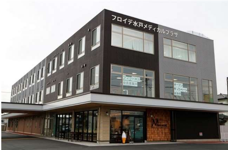
フロイデ水戸メディカルプラザの外観

延べ床面積2230m 2 の3階建てで、1階に「フロイデクリニック水戸」、通所リハビリテーション「フロイデ水戸堀町デイケアセンター」、在宅医療に関する相談窓口「フロイデ地域包括ケアセンター水戸」、コミュニティカフェ「ミッテンヴァルト」を、2階に「フロイデ小規模多機能ホーム水戸堀町」（9部屋）と「フロイデメディカルフィットネスセンター水戸」を、3階に住宅型有料老人ホーム「フロイデアシストハウス水戸堀町」（20部屋）と地域交流スペース「グーデンターク」を備えています。現在は48人のスタッフが在籍しています。