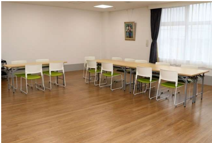
地域交流スペース「グーデンターク」