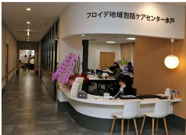
在宅相談窓口「フロイデ地域包括ケアセンター水戸」

——カフェの併設、在宅専門窓口、就労支援事業とどれも珍しいですね。続いて2階の小規模多機能ホームとフィットネスジム、3階の住宅型有料老人ホームと地域交流スペースを案内していただけますか。