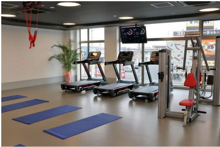
フロイデメディカルフィットネスセンター水戸